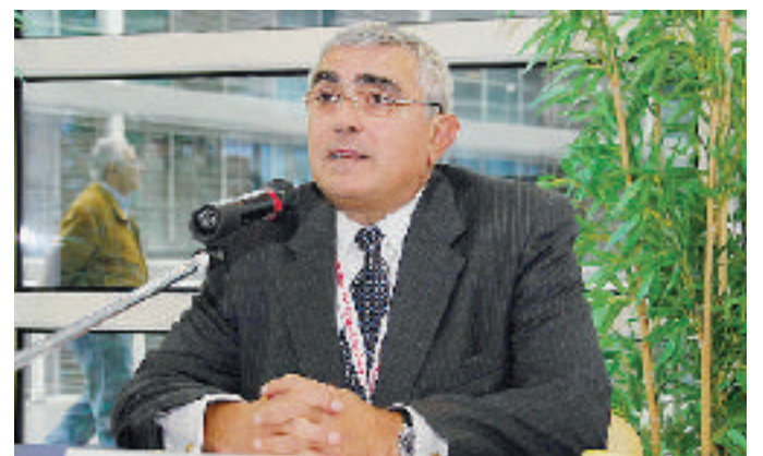
Il presidente Canavese ieri ha convocato i sindacati

Babcoke. A quel punto Campostano ha ceduto il 40% delle quote al Portlog di Gattorno e il Tri ha chiesto al tribunale il sequestro delle azioni vendute. Negli ultimi giorni sono riprese le trattative fra i vari gruppi imprenditoriali perchè il contenzioso legale si trascinerà per 20 anni. Oltretutto la Port Authority sta esercitando un forte pressing sui contendenti in modo che trovino un accordo che garantisca l'operatività del terminal. In caso contrario, il presidente del Porto chiede-