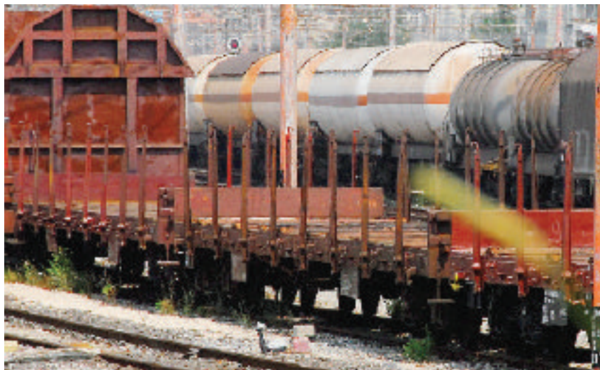
Un treno cisterna fermo nel piazzale ferroviario di Parco Doria