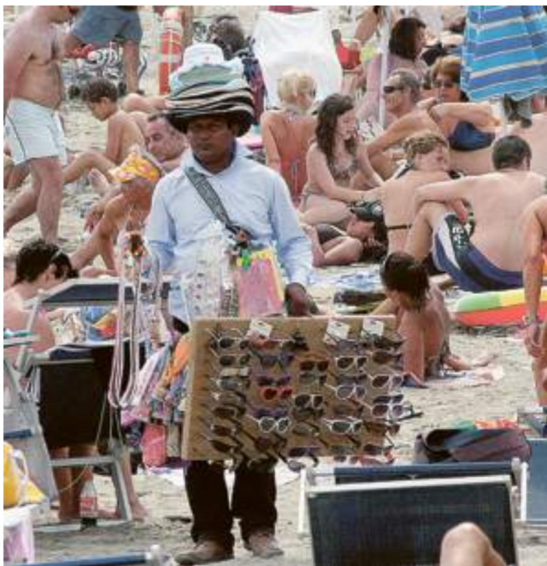
Un ambulante abusivo al lavoro su una spiaggia di Savona

«Sono arrivato a Savona da poche settimane - aggiunge il comandante della Capitaneria di porto, Giampaolo Eugenio Bensaia - ma alla luce dell'esperienza maturata in altre province balneari italiane non esito a dire