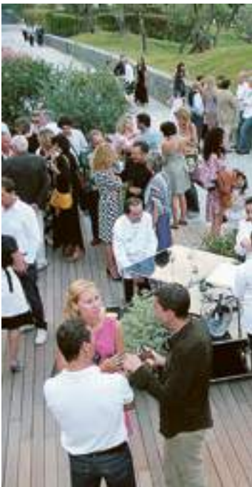
Aperitivo a bordo green