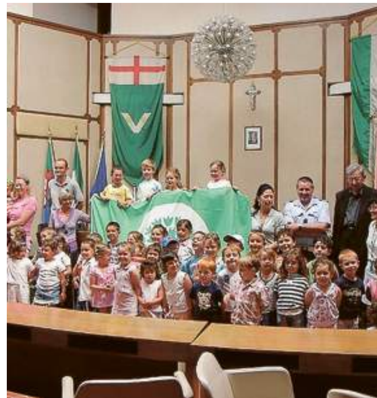
FESTA GRANDE per alunni e insegnanti della scuola materna "San Nazario". L'altra mattina, hanno ricevuto in Comune la bandiera verde per l'intensa attività svolta e rientrante nel progetto di educazione a sviluppo sostenibile di "Eco schools"