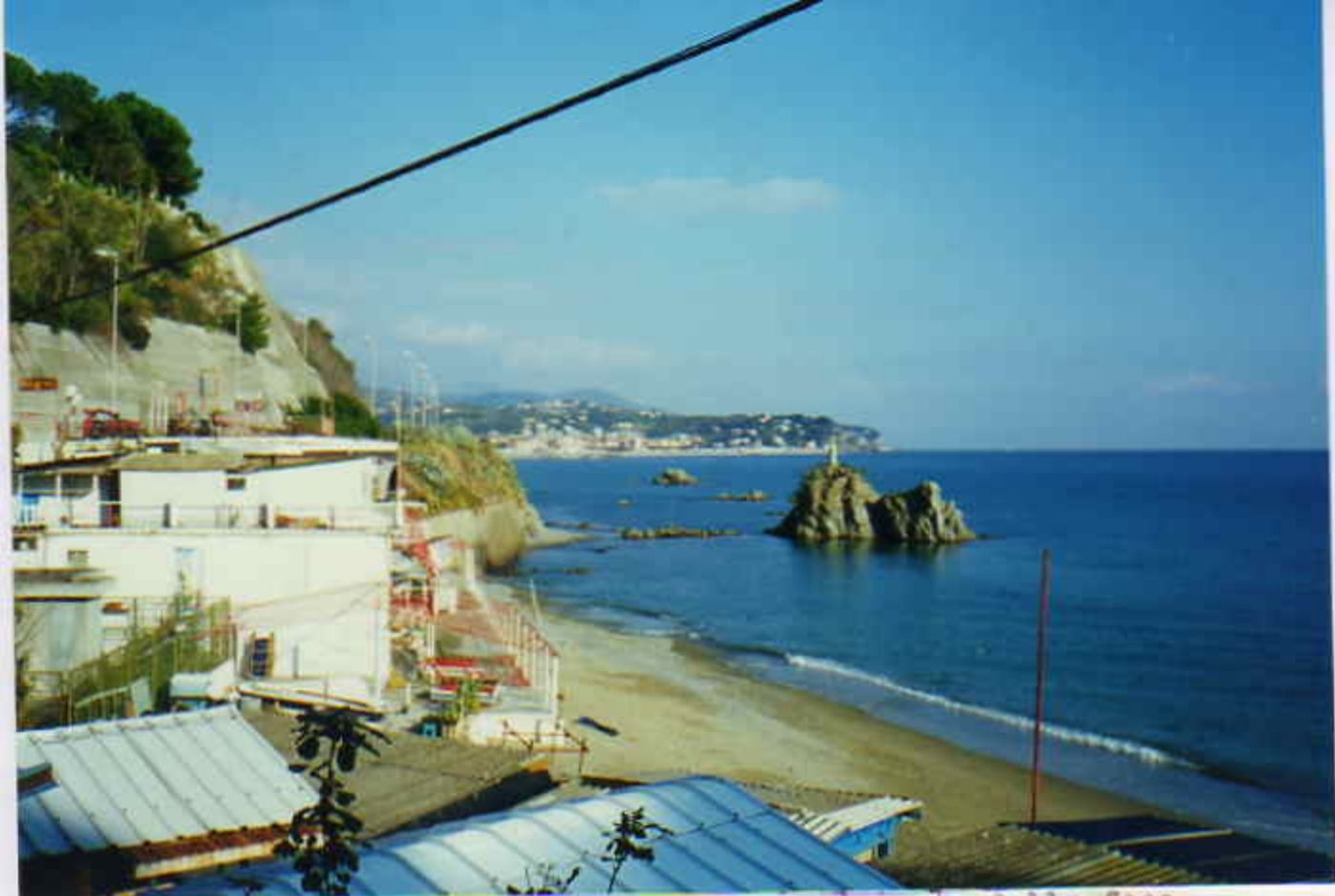
Marzo 2007-lo scoglio della Madonnetta, a levante della foce del rio Termine o del Confine, e di punta MARGONARA.