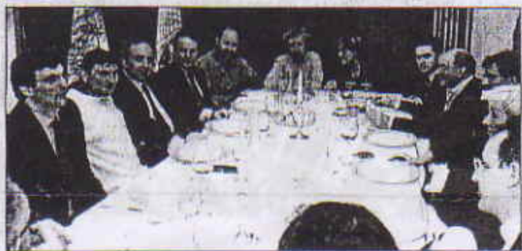
Colazione di lavoro con l'ex ministro Burlando

Colazione di lavoro del designer con l'ex ministro dei Trasporti Claudio Burlando (il primo da sinistra nella foto di Frosio) per parlare dell'operazione-Malisk. Alla Fornace di Barbafrà, a Sant'Emale, c'erano i vertici del partito oltre ad un rubito gruppo di amministratori. L'incontro, organizzato dalla segreteria provin-