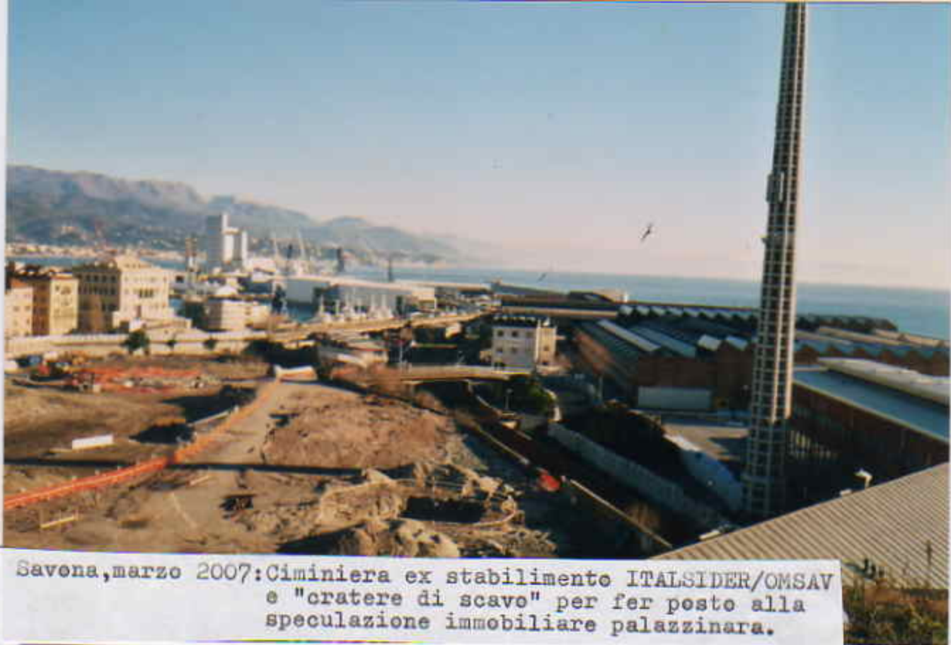
Savona, marzo 2007: Ciminiera ex stabilimento ITALSIDER/OMSAV e "cratere di scavo" per fer posto alla speculazione immobiliare palazzinara.