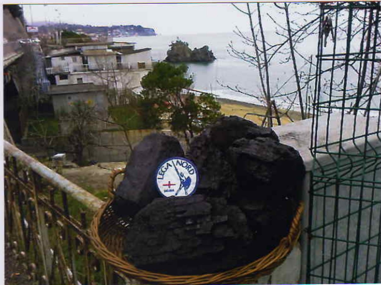
Die. 2009-Scoglio della Madonnetta con scopa e vaglio(u vallu), di cui uno pieno ed uno mezzo pieno, in pronta consegna da parte della BEFANA.