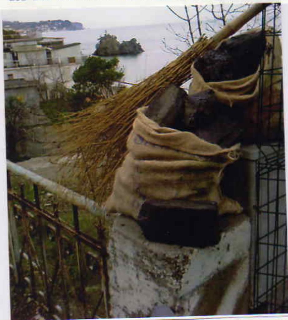
Dic. 2009-Scoglio della Madonnetta con scopa e due sacchi di carbone in pronta consegna da parte della BEFANA.