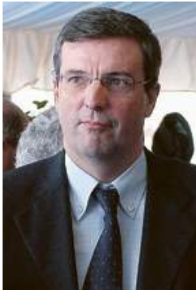
Il presidente Claudio Burlando