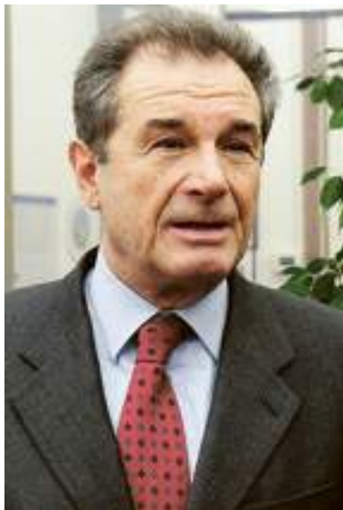
Il deputato Luigi Grillo