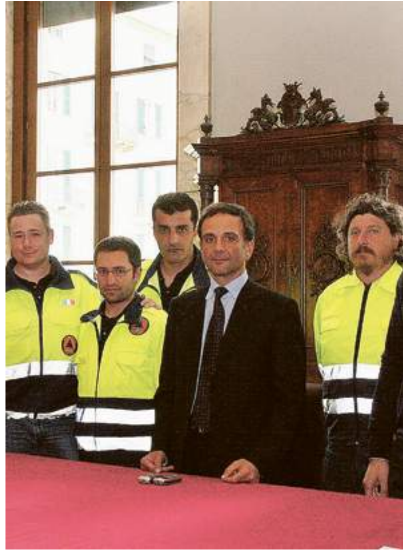
I volontari di Savona con il sindaco ieri in Comune