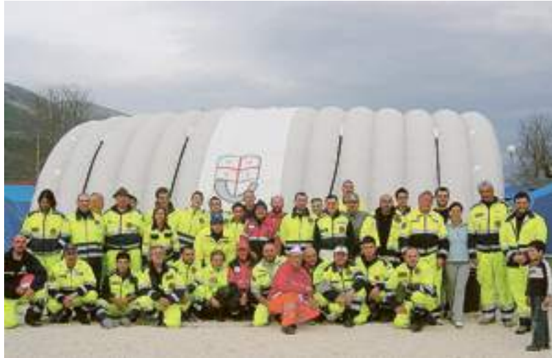
I membri della protezione civile carcaresi nel campo di Santa Maria

I volontari savonesi ospiteranno alcuni bimbi di Tione e chiedono un aiuto al sindaco Federico Berruti al quale è stato consegnato il disegno di