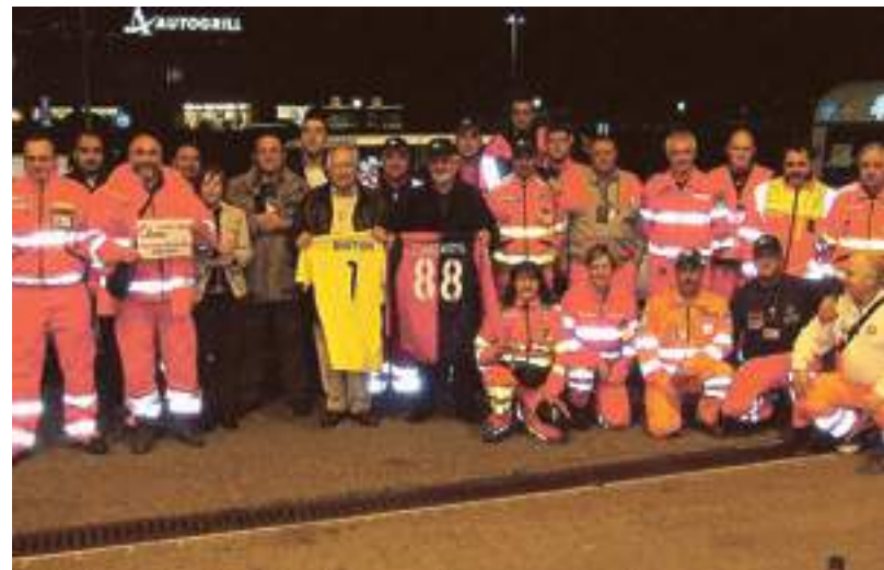
I volontari della Croce Bianca di Borghetto partiti per l'Abruzzo