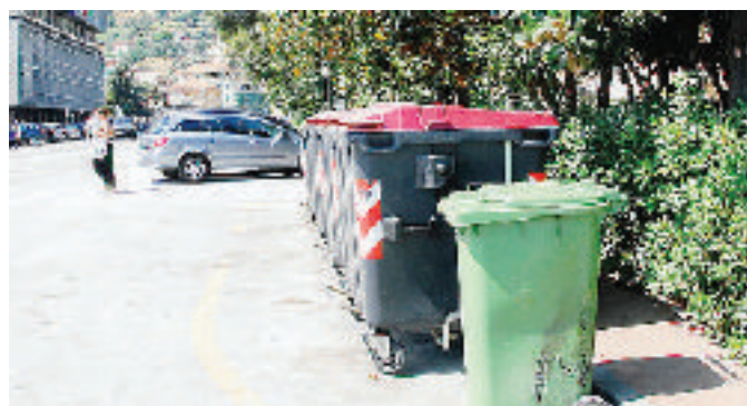
A Varazze c'è stato un incremento della spazzatura nei cassonetti