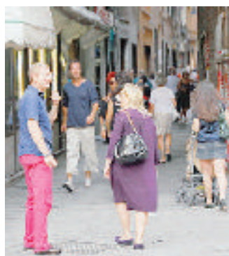
Per via Pia le assicurazioni Italgas

Via Pia, conto alla rovescia per i lavori di sostituzione di 120 metri di condotta Italgas. Da oggi i tecnici edella ditta incaricata dell'opera cominciano ad installare il by-pass, ossia la condotta provvisoria per consentire di non interrompere l'erogazione del combustibile domestico durante gli scavi. Per il 18 agosto, quindi, è confermato l'inizio dell'apertura degli scavi che, come già anticipato, interesseranno una