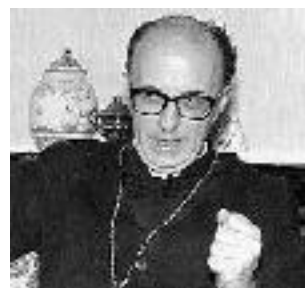
Monsignor Franco Sibilla

L'ex vescovo di Savona Franco Sibilla è morto a Genova in una casa di riposo dove era ricoverato. I funerali sono fissati per oggi dalle ore 16 nella Basilica Cattedrale di San Lorenzo ed è prevista una folta partecipazione da parte del clero ligure. Nato a Torino il prelado aveva 85 anni. Eletto alla sede vescovile di Savona-Noli il 15 luglio 1974 e venne ordinato vescovo il 29 settembre di quell'anno. Trasferito alla diocesi di Asti l'8 settembre 1980, monsignor Sibilla divenne emerito il 16 marzo 1989, poi sostituito da monsignor Severino Poletto. [A.V.]