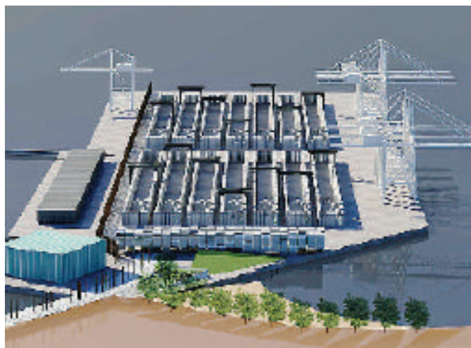
La proiezione al computer del progetto per la nuova piattaforma

Una commissione incaricata ha già scelto lo studio redatto dal consorzio formato da M&L e Studio 4. Il sovrappasso sarà localizzato nell'area in cui oggi corre il na-