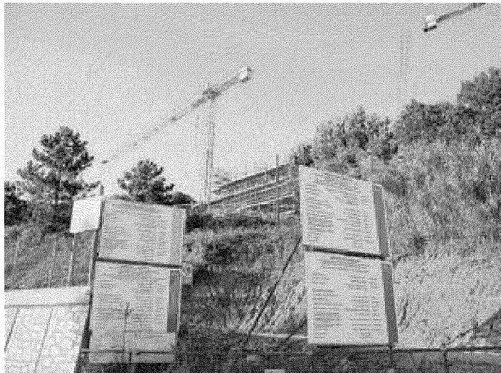
Un particolare dei cantieri in corso a Lerca, attorno al campo da golf