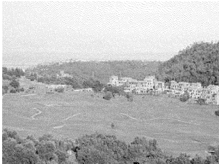
Il nuovo paese di Lerca sorto attorno alle diciotto buche di Sant'Anna