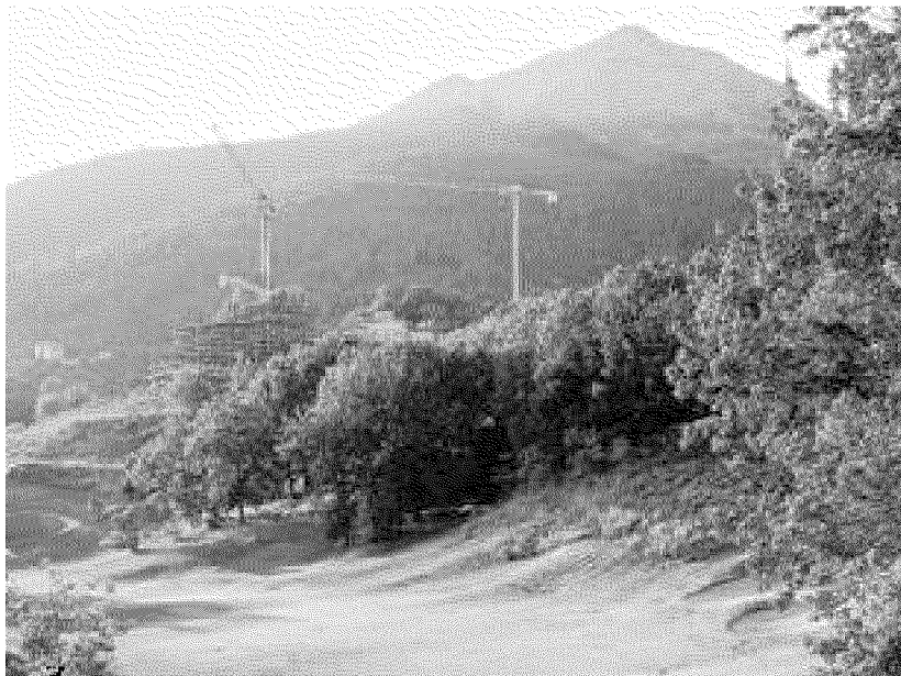
Nei pressi della club house dovrà sorgere un hotel